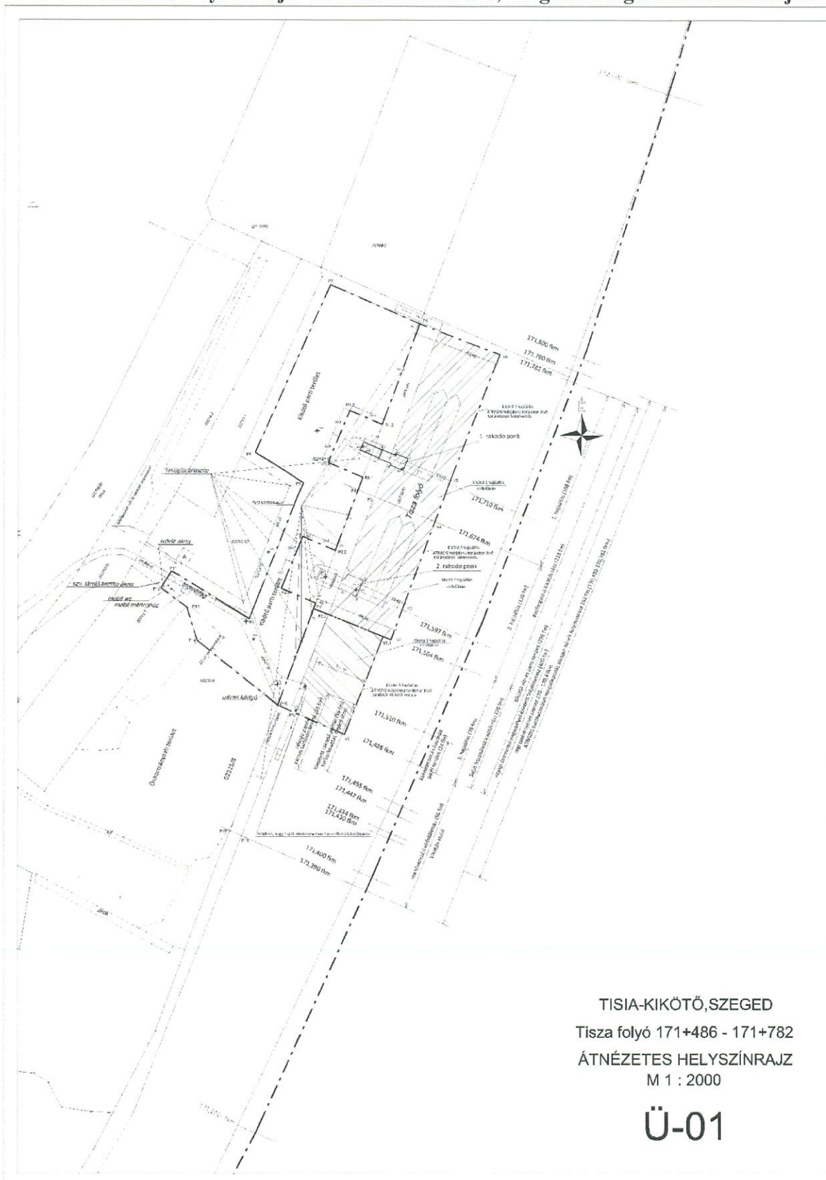
TISIA-KIKÖTŐ, SZEGED Tisza folyó 171+486 - 171+782 ÁTNÉZETES HELYSZÍNRAJZ M 1 : 2000 Ü-01